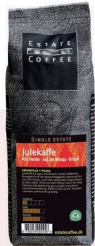
Kaffe i juletiden Julekaffe, Estate Coffee, 200 gram, 60 kr.