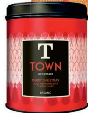
Merry Christmas Te, Merry Christmas fra T Town hos Chokolade Compagniet, 149 kr.