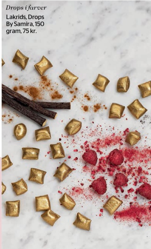
Drops i farver Lakrids, Drops By Samira, 150 gram, 75 kr.