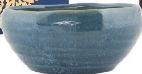
Fyldt op med brunkager Skål, Nord fra House Doctor, h 6,6 x diam. 14,5 cm, 54,95 kr.