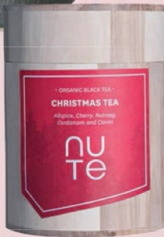
Jeg skal slubre masser af julete Te, Christmas Tea fra Nute hos Chokolade Compagniet, 100 gram, 99 kr.