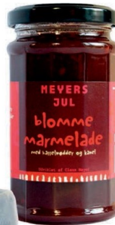
Tilbehør til julemaden Blommemarmelade, Meyers, 39,50 kr.