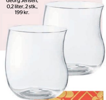
Til en slurk Glas, Cobra fra Georg Jensen, 0,2 liter, 2 stk., 199 kr.