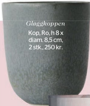
Gløggkoppen Kop, Ro, h 8 x diam, 8,5 cm, 2 stk., 250 kr.