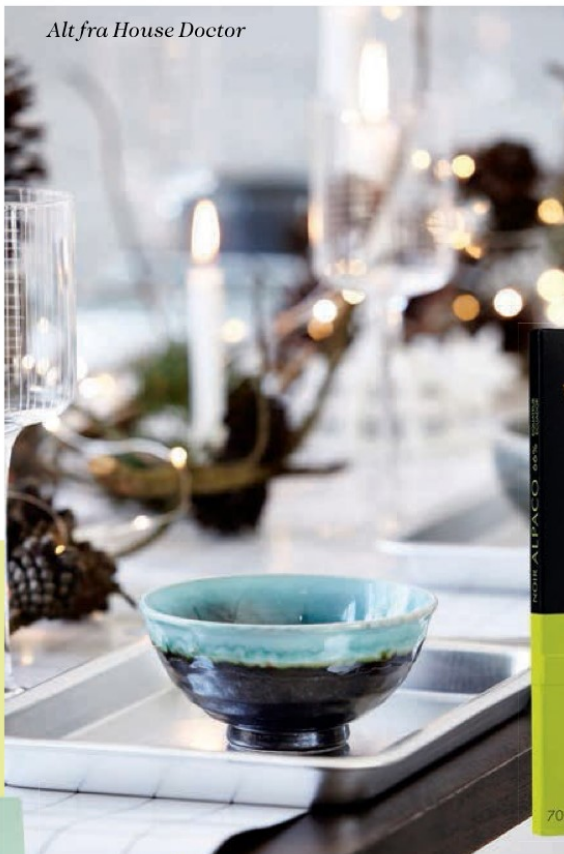
Alt fra House Doctor

Nydelig nougat Glutenfri nougat med mandler, Nicolas Vahé, 180 g, 64 kr.